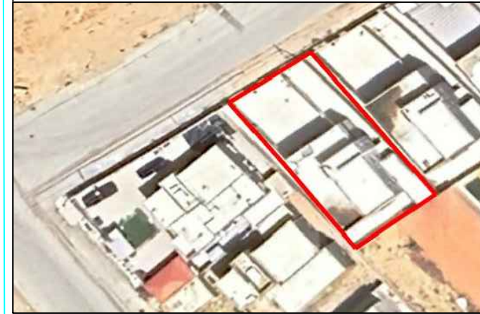
صور من الموقع