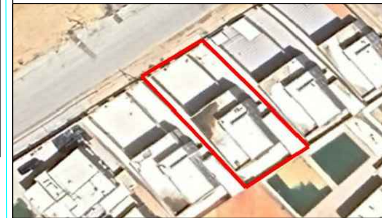
صور من الموقع