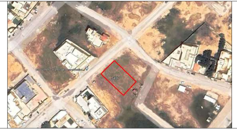
صور من الموقع