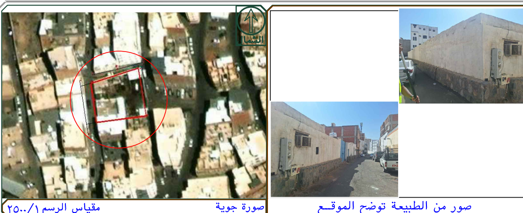
صورة جوية / صور من الطبيعة توضح الموقع / مقياس الرسم ٢٥٠٠/١