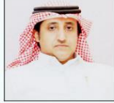
المقر الرئيسي: بريدة