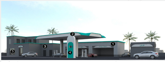
1 كلابنج ريادي فاتح مغلوب للحريق 2 كلابنج أبيض مغلوب للحريق 3 كلابنج ريادي غامق مغلوب للحريق 4 كلابنج أخضر مغلوب للحريق 5 جناح أستراكشر سيكورت